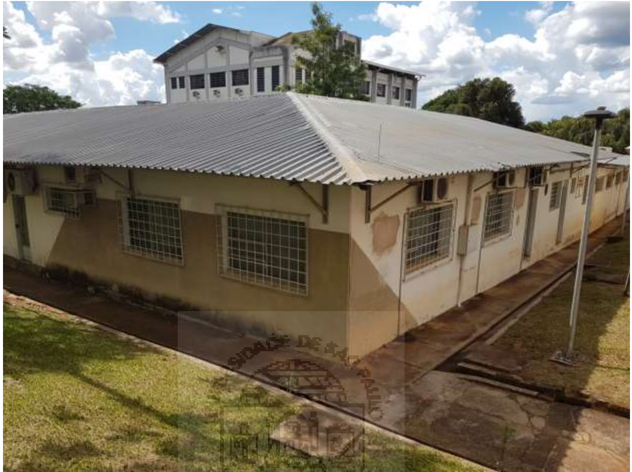
Lab. Termodinâmica - SEM