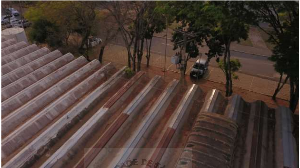
Cobertura LAB. Estruturas SET