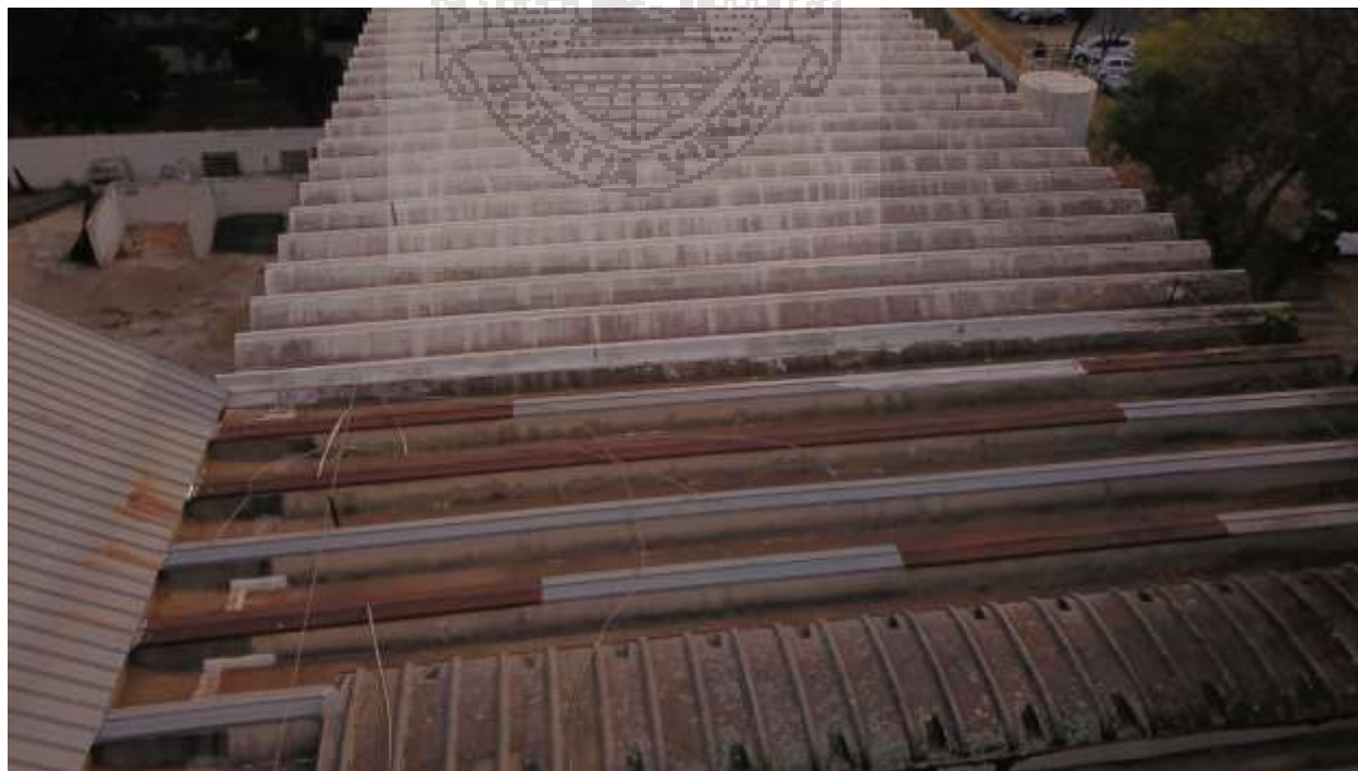
Cobertura - Lab Estruturas SET