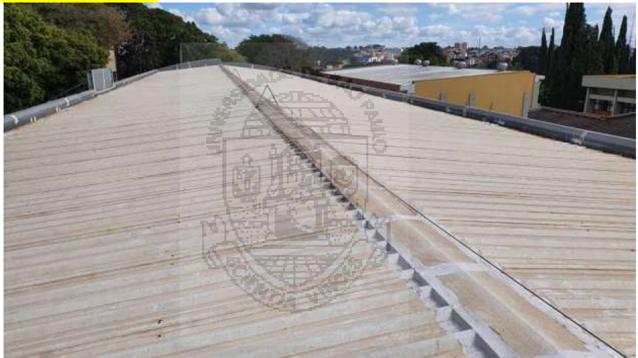
Cobertura do CETEPE