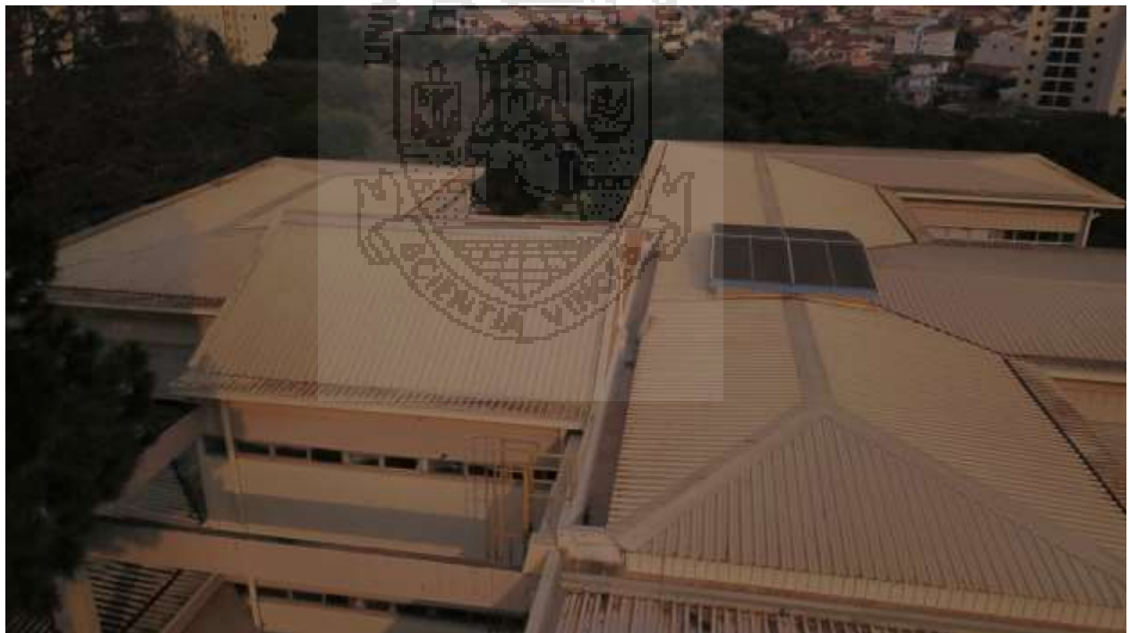
Cobertura Prédio SET